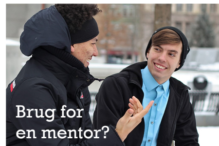
Brug for en mentor?