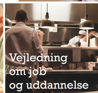
Vejledning om job og uddannelse