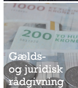
Gælds- og juridisk rådgivning