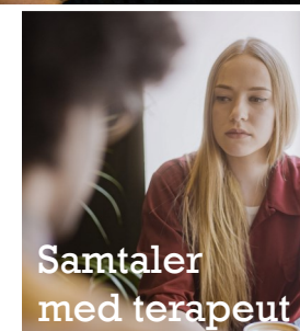
Samtaler med terapeut