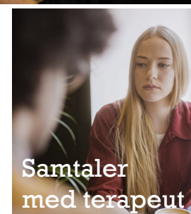
Samtaler med terapeut