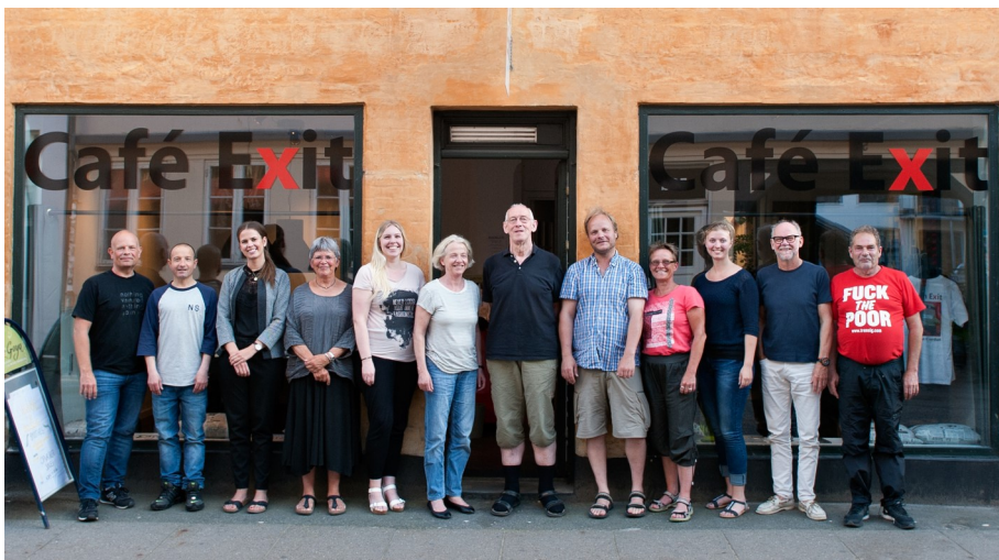
En del af Café Exits af frivillige og lønnede medarbejdere i Aarhus foran cafélokalerne i Vestergade 43.