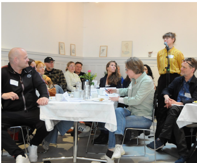
Glimt fra Samling 2023.

Indsatte og tidligere indsatte deltog i visionsdag forud for udarbejdelsen af ny treårig strategi for Café Exit.