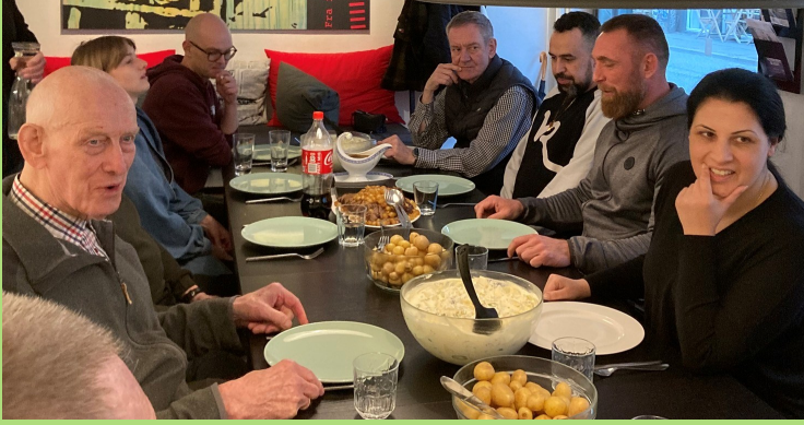
Hver onsdag er der madklub for tidligere indsatte og pårørende i caféen i Aarhus.