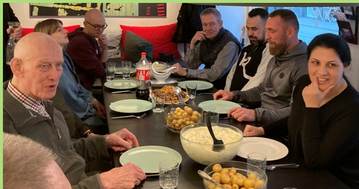
Hver onsdag er der madklub for tidligere indsatte og pårørende i caféen i Aarhus.