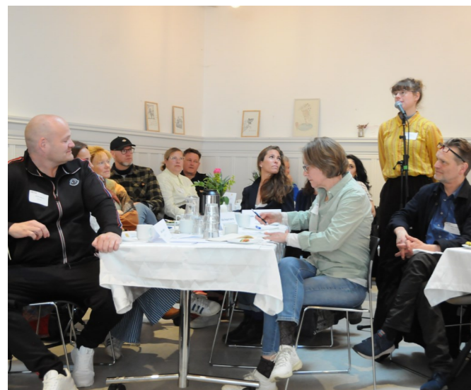
Glimt fra Samling 2023.